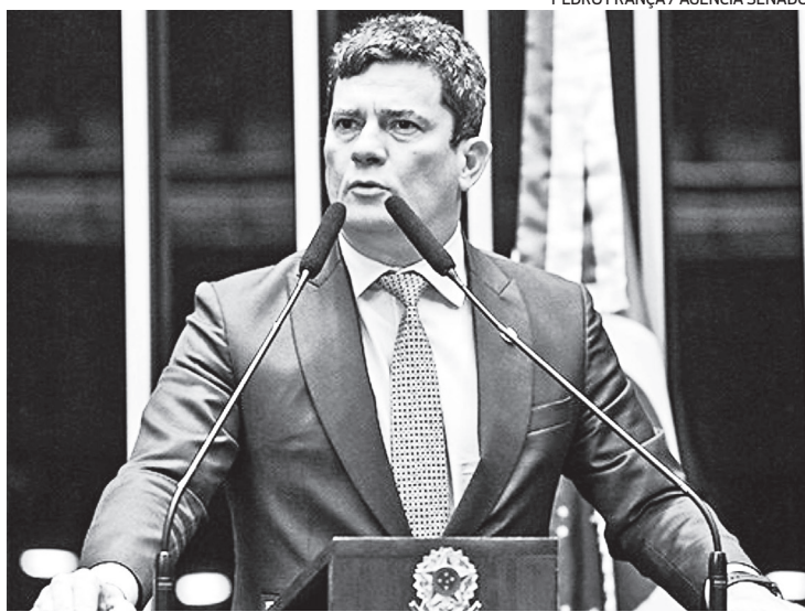
Sergio Moro (União-PR) é acusado de abuso de poder econômico

O desembargador Luciano Carrasco Falavinha Souza, do TRE do Paraná, votou contra a cassação de Sergio Moro. Após o voto do relator, a sessão foi suspensa e será retomada hoje. Faltam os vo-